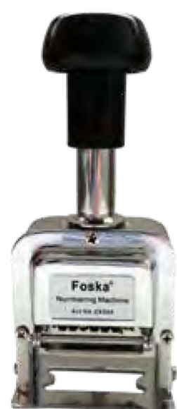
Mod. FOSKA 6 bandas, 4,5 mm altura nº