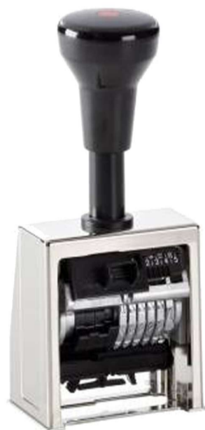
Mod. REINER 6 bandas, 4,5 mm altura nº